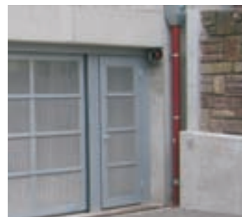
Seitentüren in Toroptik

Alle Haupt- u. Nebenschließkanten sind abgesichert. Im Notfall kann der Antrieb ausgekuppelt und das Tor per Hand aufgeschoben werden.